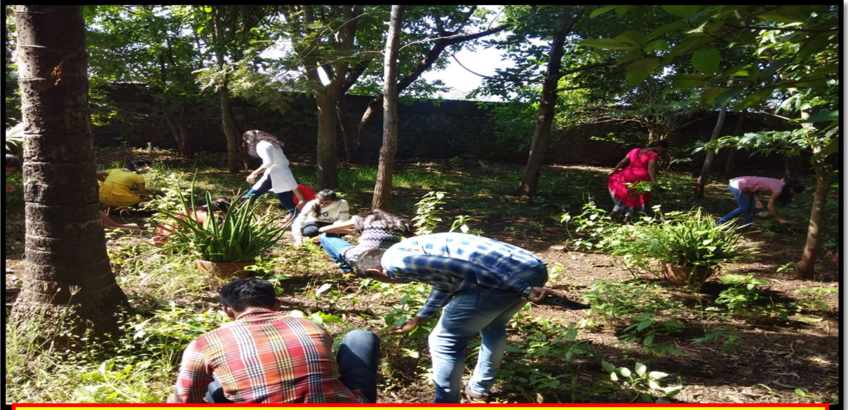
राष्ट्रीय सेवा योजनेचे स्वयंसेवक वनस्पती उद्यानाची स्वच्छता करताना