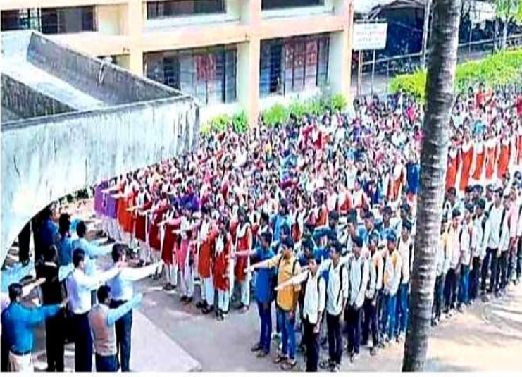
वारणानगर : येथील यशवंतराव चव्हाण वारणा महाविद्यालयामध्ये आयोजित संविधान दिनानिमित्त 'संविधान शपथ' घेताना विद्यार्थी, स्वयंसेवक, प्राध्यापक, प्राध्यापकेतर कर्मचारी आदी.

Kolhapur, Kolhapur-Today 27/11/2019 Page No. 9