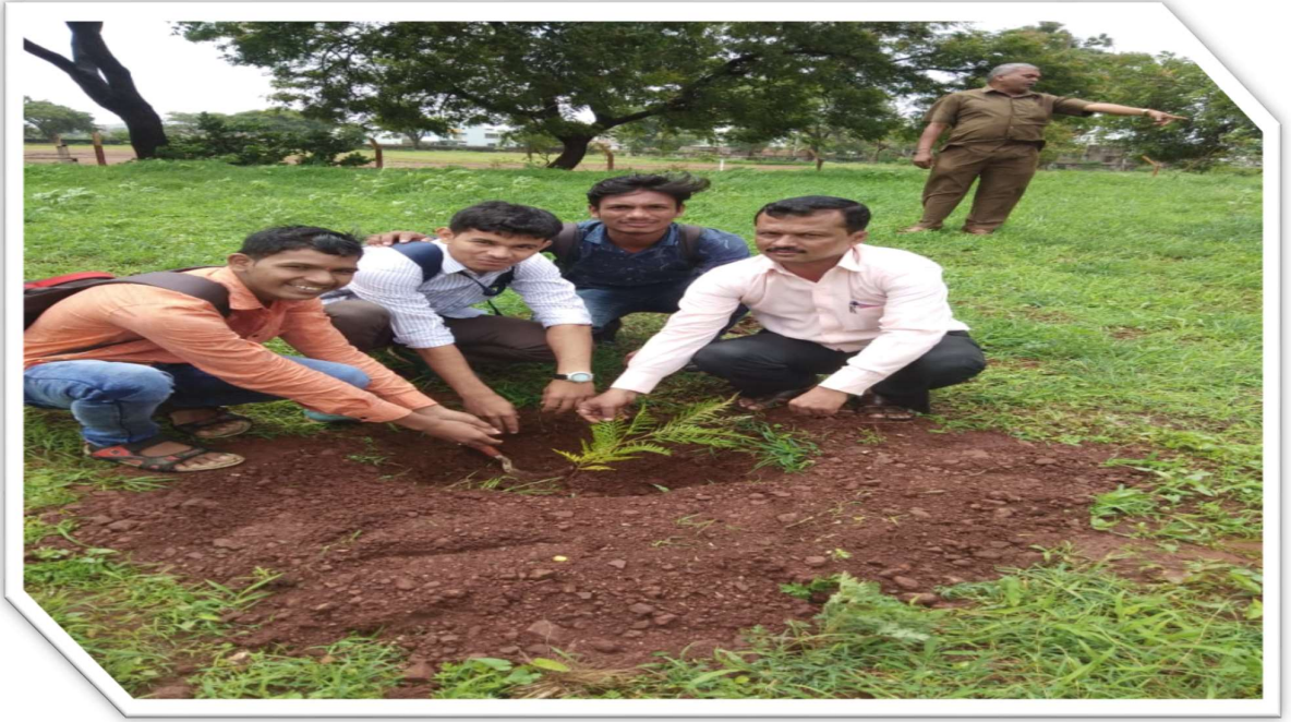
राष्ट्रीय सेवा योजनेचे स्वयंसेवक व कार्यक्रम अधिकारी वृक्षारोपण करताना