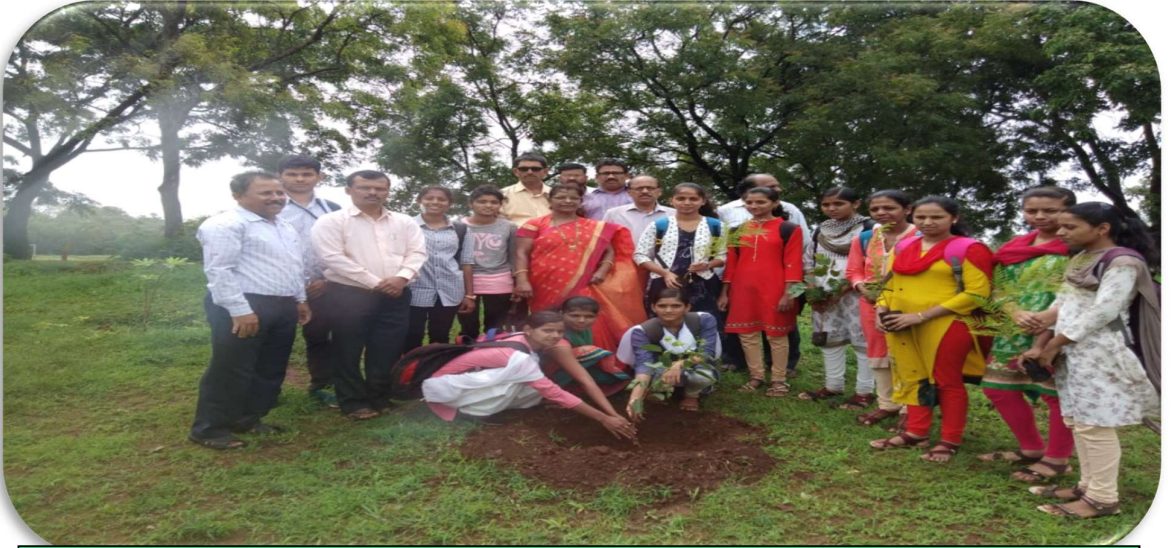
राष्ट्रीय सेवा योजनेचे स्वयंसेवक वृक्षारोपण करताना