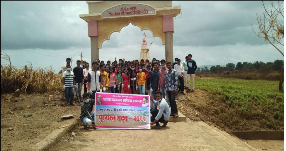
राष्ट्रीय सेवा योजनेचे स्वयंसेवक पूरग्रस्त जुने चावरे याठिकाणी स्वच्छता करताना