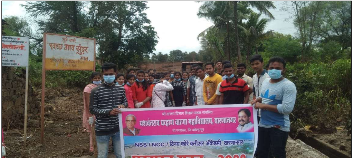
राष्ट्रीय सेवा योजनेचे स्वयंसेवक पूरग्रस्त जुने चावरे याठिकाणी स्वच्छता करताना