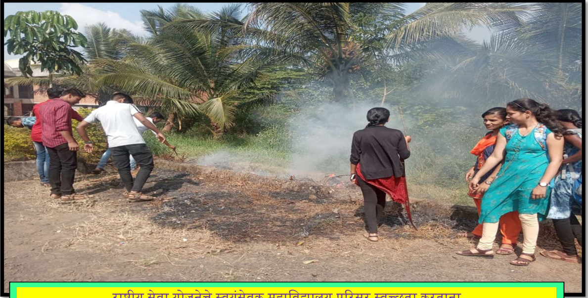
राष्ट्रीय सेवा योजनेचे स्वयंसेवक महाविद्यालय परिसर स्वच्छता करताना