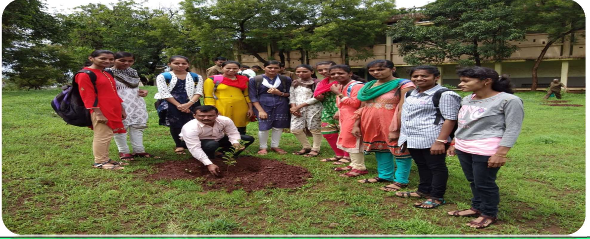
कार्यक्रम अधिकारी आणि स्वयंसेवक वृक्षलागवड करताना