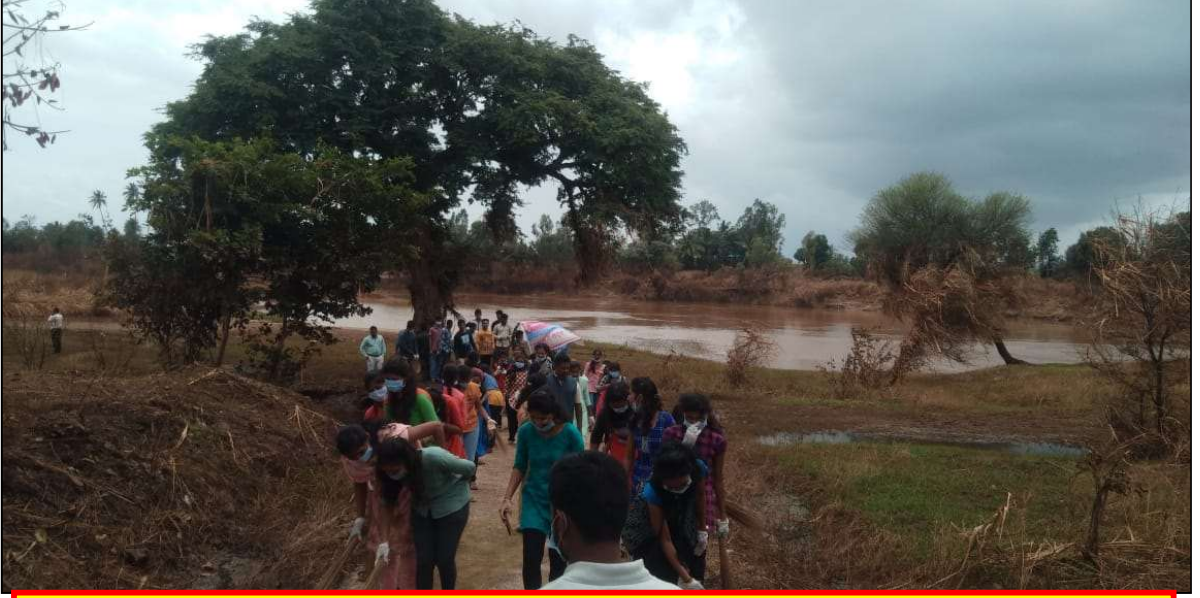
राष्ट्रीय सेवा योजनेचे स्वयंसेवक पूरग्रस्त जुने चावरे याठिकाणी स्वच्छता करताना