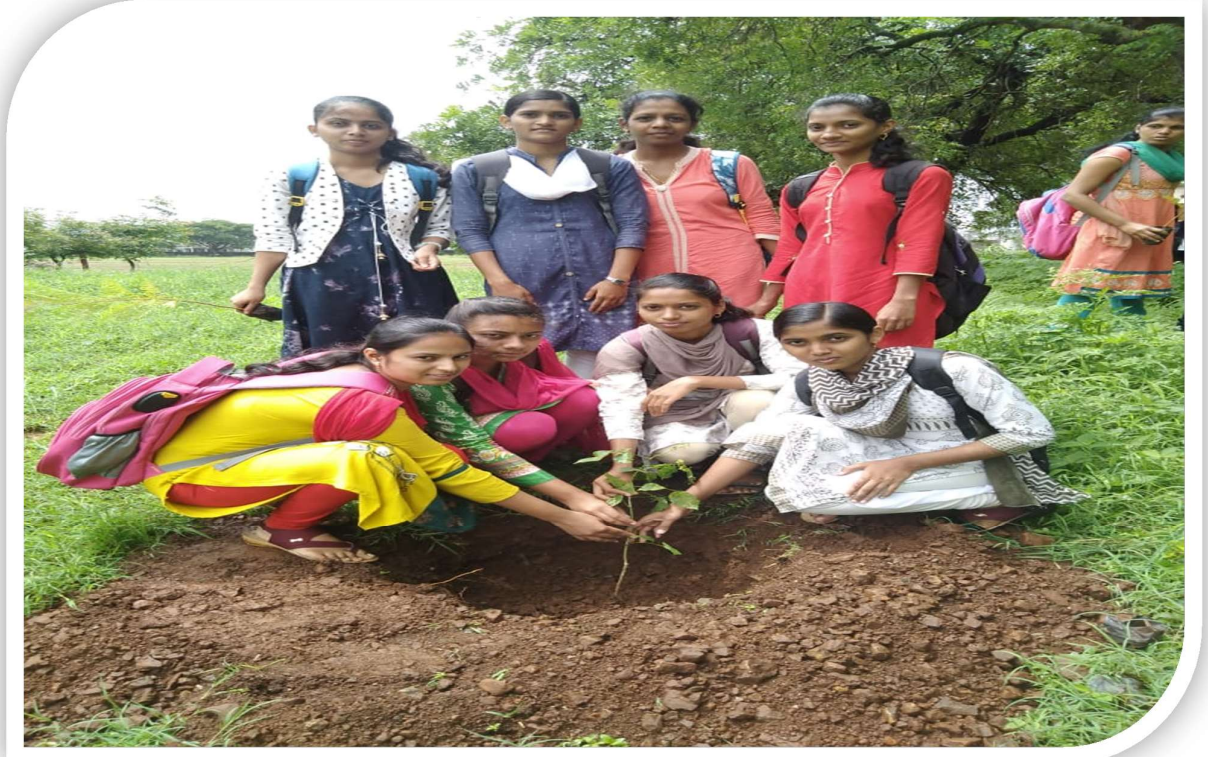
राष्ट्रीय सेवा योजनेचे स्वयंसेवक वृक्षारोपण करताना